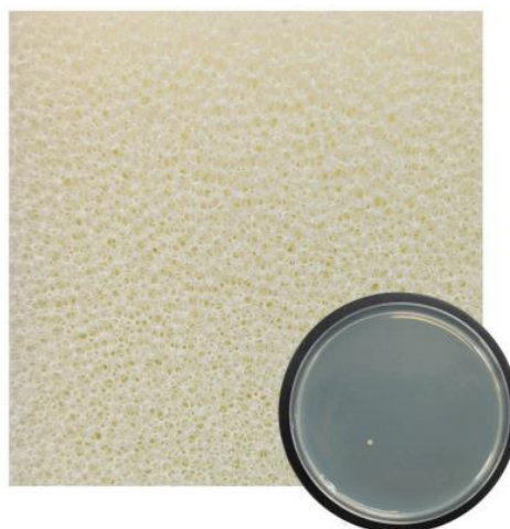
Treated with Ultra-Fresh®