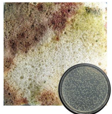
Regular untreated foam

Foam treated with Ultra-Fresh® antimicrobial technology has 99.9% fewer bacteria compared to untreated foam. Ultra-Fresh® is a registered trademark of Thomson Research Associates, Inc.